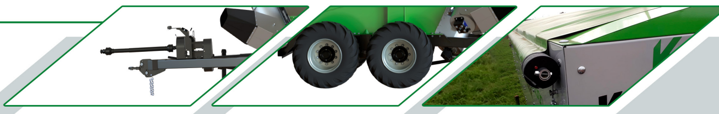
KIT LONA FÁCIL