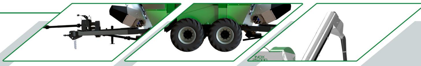
PONTEIRA ADAPTADA PARA ADUBO